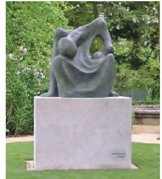
Skulptur "Ohne Namen" von Vittore Bocchetta, Künstler und Überlebender, aus Verona/Italien. 2007 - Am Eingang zum Rosengarten.

Das Lager Hersbruck war ein Außenlager des KZ Flossenbürg, das drittgrößte Konzentrationslager in ganz Süddeutschland (nach Dachau und Flossenbürg), gemessen an der Zahl der Toten eines der schlimmsten.