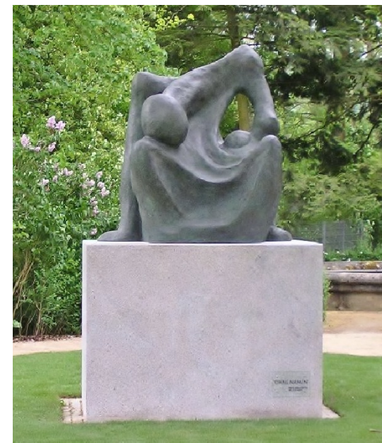
Skulptur "Ohne Namen" von Vittore Bocchetta, Künstler und Überlebender, aus Verona/Italien. 2007 - Am Eingang zum Rosengarten.

Das Lager Hersbruck war ein Außenlager des KZ Flossenbürg, das drittgrößte Konzentrationslager in ganz Süddeutschland (nach Dachau und Flossenbürg), gemessen an der Zahl der Toten eines der schlimmsten.